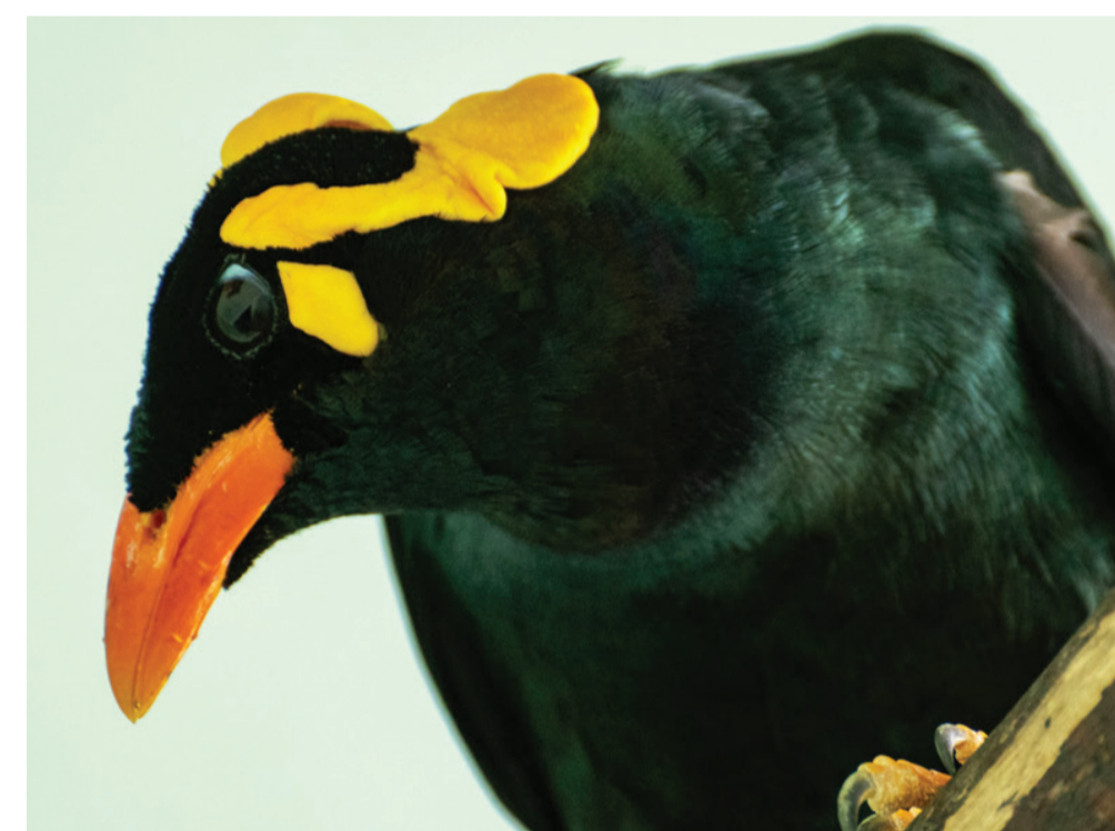
Tenggarabeo ( Gracula venerata ) - PCBA