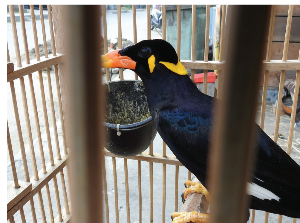
Einzelhaltung von Beos als Käfigvogel - S. Bruslund