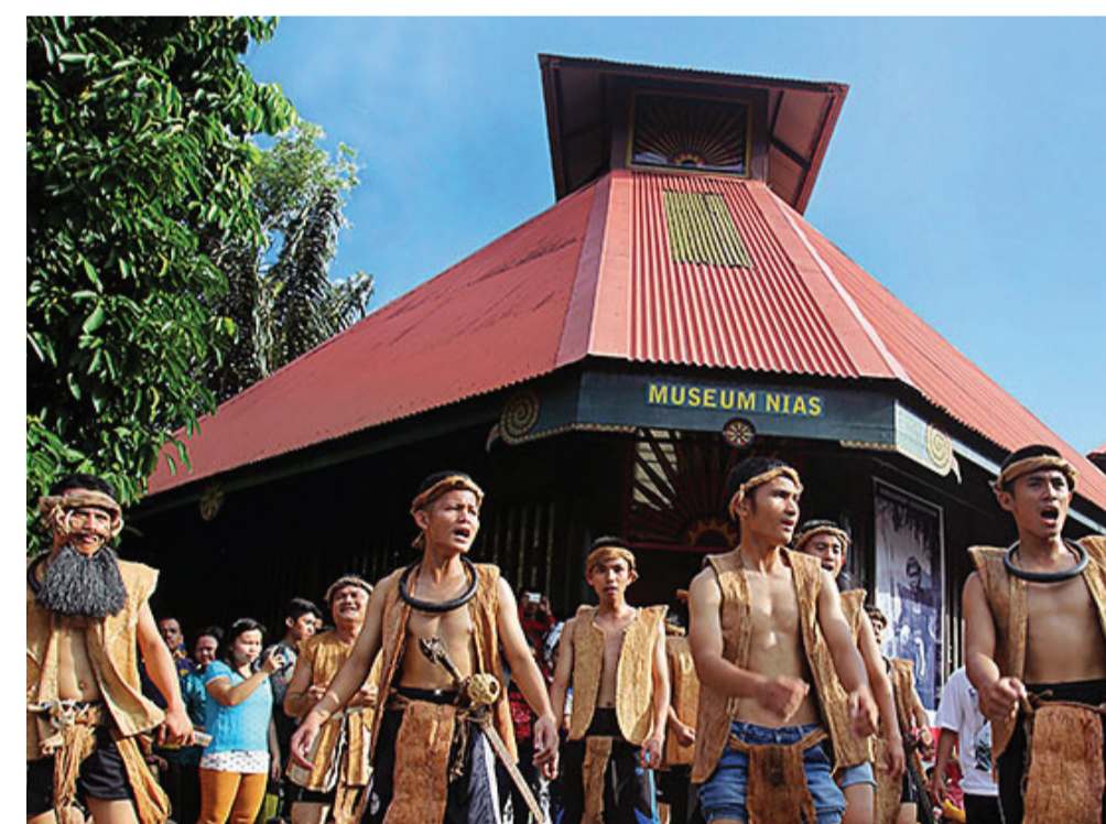
Nias Heritage Museum