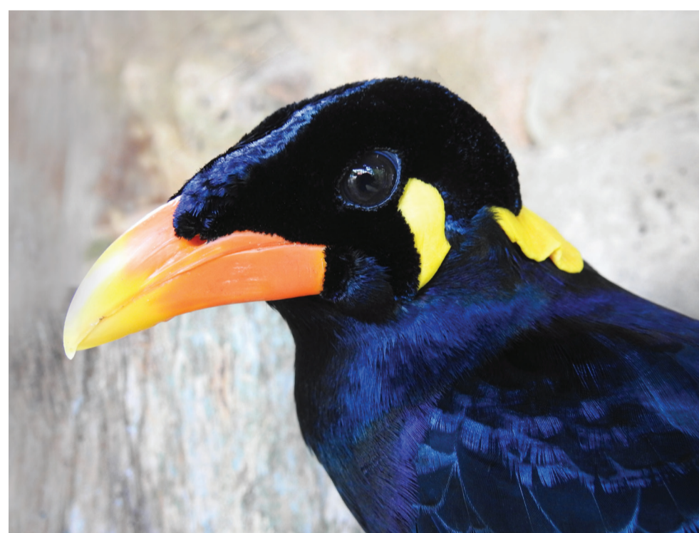
Nias Beo ( Gracula robusta ) - N. Bruslund

Durch Ihre Spende werden neue Erhaltungszuchtvolieren für Beos gebaut. Den Ort dafür stellt das Kulturmuseum in Nias zur Verfügung und übernimmt auch die Betreuung der Tiere. Des Weiteren werden von der „Zootier des Jahres“ Kampagne spezielle Baumschulen in der Umgebung angelegt, um den Beos für eine spätere Auswilderung Futterpflanzen zu sichern. Auch die Öffentlichkeitsarbeit und die Entwicklung eines gewissen Nationalstolzes für den Nias Beo sind ein wichtiger Bestandteil der Projektarbeit.