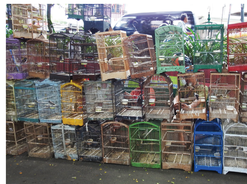
Vogelmarkt auf Java - S. Bruslund