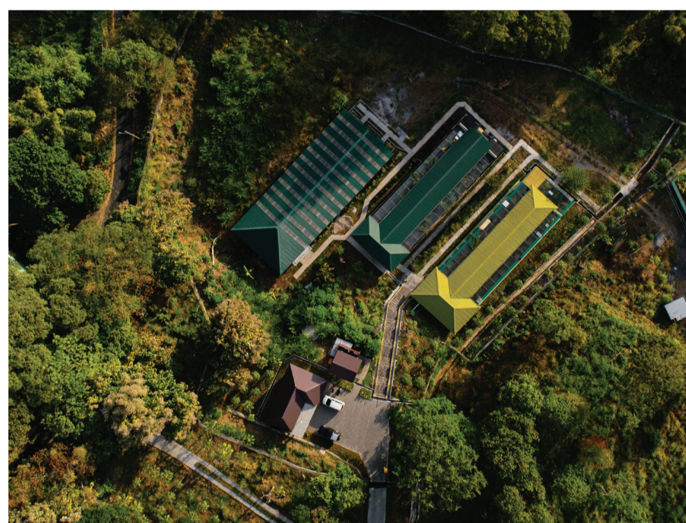
Zuchtvolieren der PCBA

Durch Ihre Spende wird ein eigens für die anspruchsvollen Bedürfnisse der Beos entworfener Volierenkomplex gebaut. Mit genügend Platz, damit sich neu gefundene, harmonisierende Beo-Paare zurückziehen können. Die kompatiblen Brutpaare sorgen hoffentlich für mehr Beo-Nachwuchs, um die Sicherung ihrer Bestände zu gewährleisten.