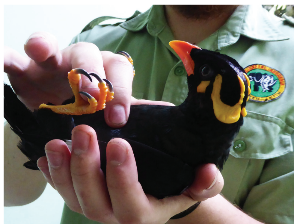
Gesundheitscheck neuer Zuchtvögel - T. Kwapil